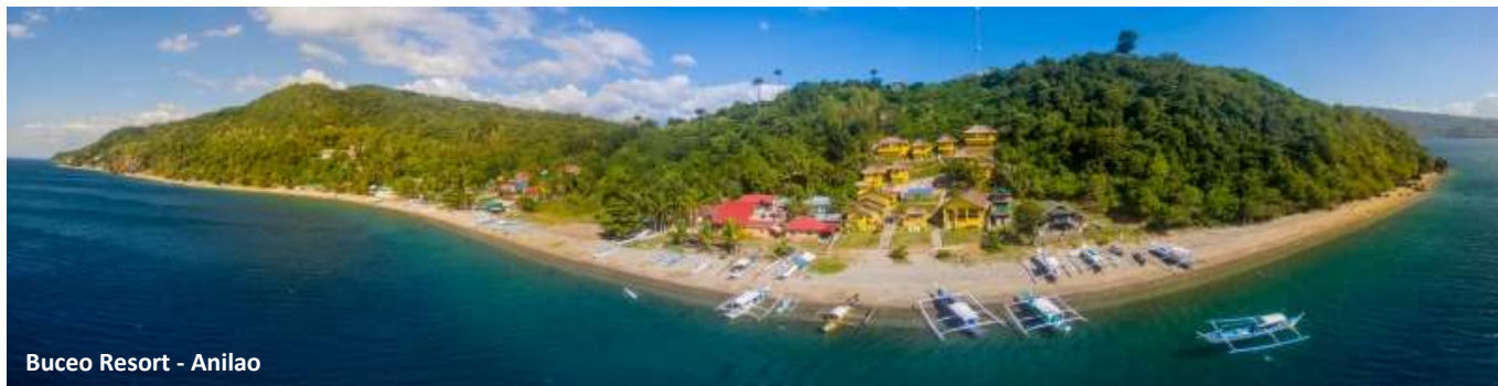
Buceo Resort - Anilao