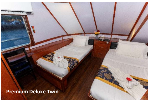
Premium Deluxe Twin

Zehn Kabinen, die sich über drei Decks verteilen, jede Kabine mit eigenem Badezimmer. Dazu: Ein großzügiger Salon mit Wohn- und Essbereich, Bar, TV und kleiner Bibliothek, riesiges Sonnendeck mit gepolsterten Liegen und Hängematten, Außenlounge, separater Kameraraum. Modernste Tauchausrüstung, großes, beschattetes Tauchdeck, Bauer Kompressor, Nitrox Membrananlage. Sicherheitseinrichtungen auf neuestem Stand.