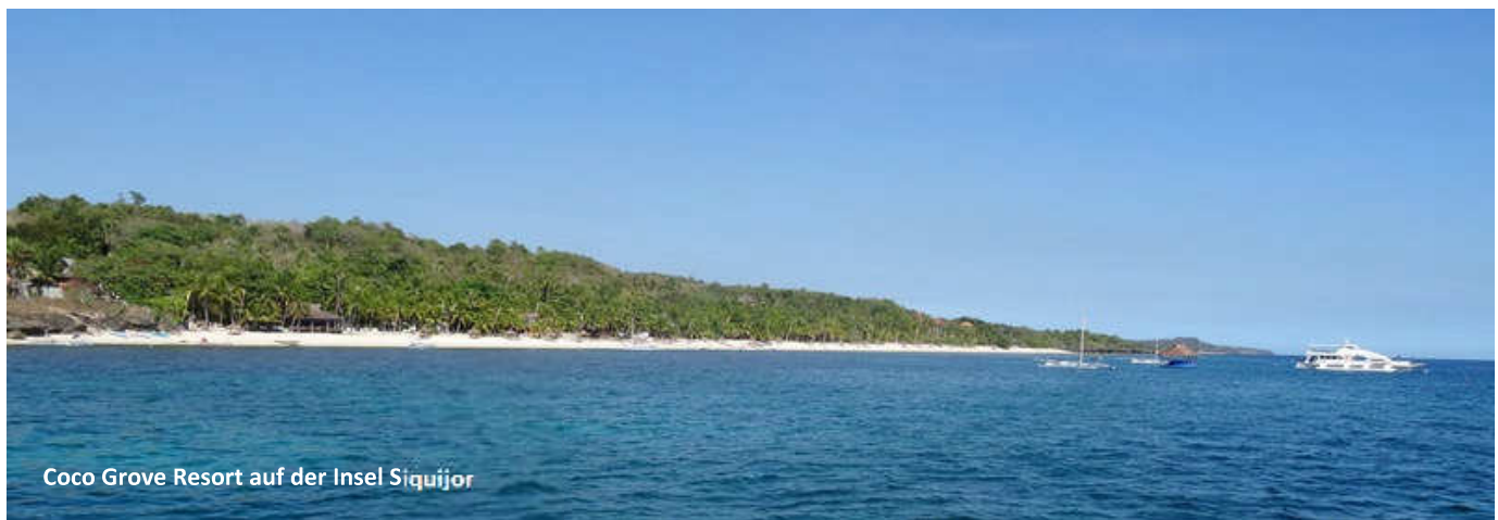
Coco Grove Resort auf der Insel Siquijor

Apo Island. Der Platz ist atemberaubend: ein traumhaftes Resort an einem kleinen weißen Sandstrand umgeben von Klippen. Kann schon sein, dass man die letzten Meter bis zum Strand schwimmen muss. Fantastische Korallenriffe, 13 Tauchgänge während der Safari, sieben während der zwei Nächte im Apo Island Resort (mit Vollpension). Am Abend Dinner am Strand, dazu einen Mangosaft oder –cocktail schlürfen. Zwei Nächte in einem Naturresort mit Ventilator und Moskitonetzen. Nachts wird der Strom abgeschaltet, doch es liegen Taschenlampen bereit (und die Taucherlampe gibt's ja auch noch). Ein großer Wassertrog im Bad mit Schöpfkelle erschließt ein neues Duscherlebnis.